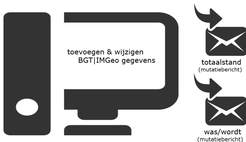
Figuur 1 Certificeringniveau BASIS: Toevoegen en wijzigen BGT|IMGeo gegevens

Het verwacht testresultaat is dat alle gegevens zoals opgevoerd in de BGT bronhouderssoftware in het geëxporteerde mutatiebericht zijn opgenomen (volledigheid) en dat het mutatiebericht succesvol valideert tegen de validatietools (juistheid).